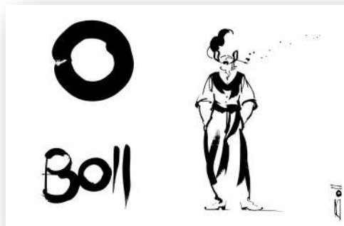
BOLL dessinateur de presse Les échos, Lire etc.