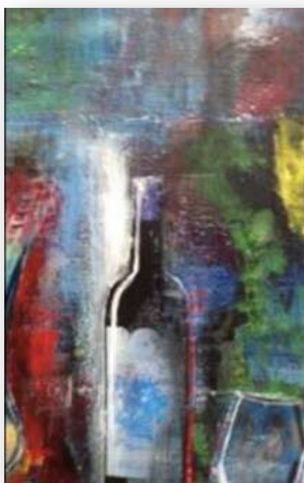
Vin et tactique détail

Artiste peintre formée aux Beaux-Arts de Mulhouse, Toulouse puis Poitiers, mon parcours débute par la sculpture. Cette approche du volume et de la matière reste au coeur de mon travail pictural. Aujourd'hui, je conçois mes toiles comme des objets, en les façonnant par superpositions et textures. Mon travail explore la frontière entre peinture et sculpture, dans une recherche plastique singulière. « Couleurs et abstraction pour laisser courir notre imagination ».