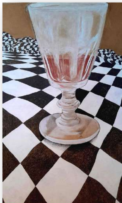
Le Verre à moitié plein Le Verre à moitié vide

Et c'est ainsi qu'un ami bien attentionné, un jour au siècle dernier, la désigna sous le nom de sérial painter .