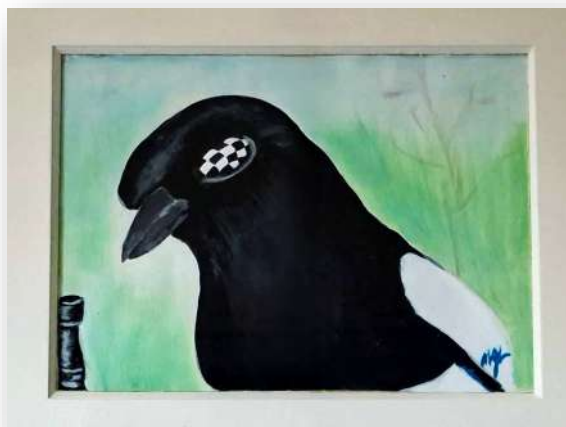
La Pie est joueuse

« Je suis un omnivore avide de sentiments, d'êtres vivants, de livres, d'événements et de batailles. » (Pablo Neruda)