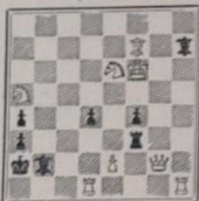
Mat en 2 coups 8+8