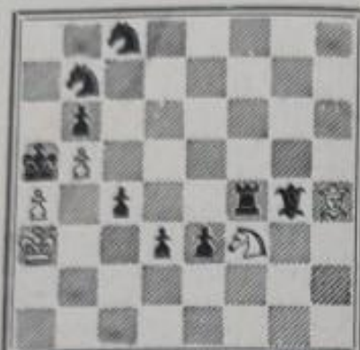
Mat en 3 coups 5+9