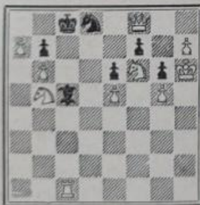
N o 784. — R. Svchora à Prague (Inédit)