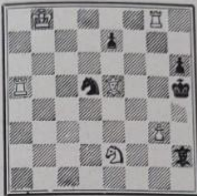
Mat en 2 coups 6+5