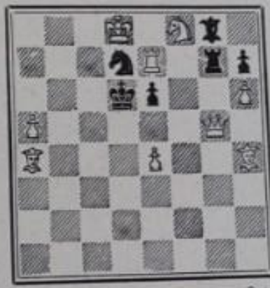
Mat en 2 coups 9+6