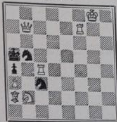
Mat en 2 coups 6+5