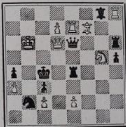
Mat en 2 coups 10+9