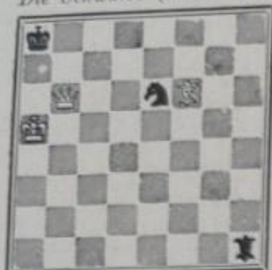
Mat en 3 coups 3+3