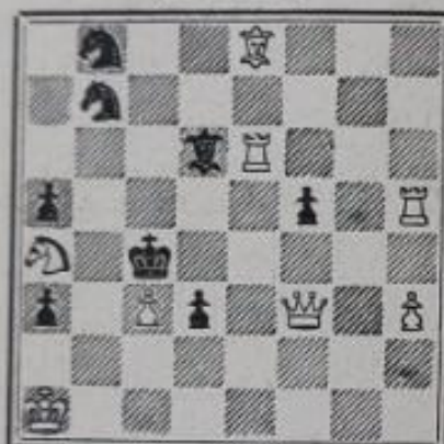
Mat en 3 coups 7+9