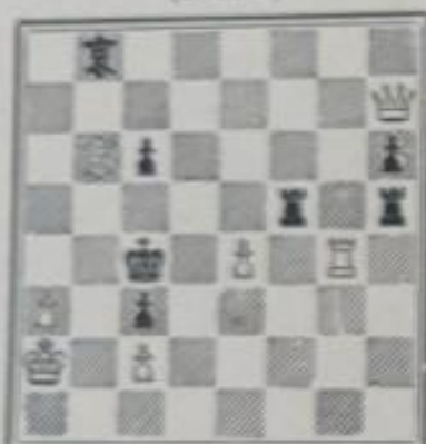
N o 781. — Nedôy à Nantes (Inédit)