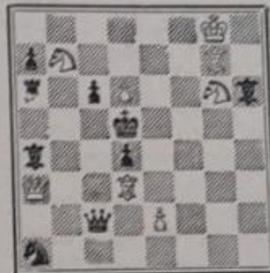
Mat en 3 coups 8+9

N° 768. — I. Mikan 3 e prix. Sachovy List (1935)