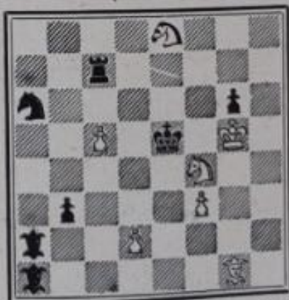
Mat en 2 coups 7+7