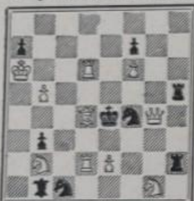
Mat en 3 coups 10+9