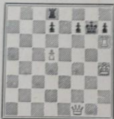
N o 783. — E. Diard Dédié à la mémoire de L. Lamérat (Inédit)