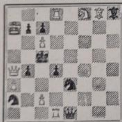
Mat en 2 coups 9+9

à la Da4 la surveillance de c4 ce qui permet le mat par interception du Fg8. Les inédits doivent parvenir à M. André Marceil avant le 1 er janvier 1937; ils seront publiés dans l'Echiquier ou le Bulletin de la F. F. E. et les meilleurs problèmes seront récompensés de plusieurs prix dont trois cents francs en espèces. Juge : M. Edouard Pape.