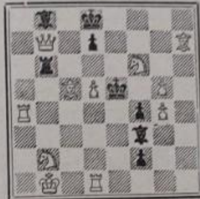
Mat en 2 coups 11+8

N° 767. — A.-F. Arguelles 2 e prix. Escacs a Catalunya (1935)