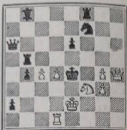
Mat en 2 coups 8+9