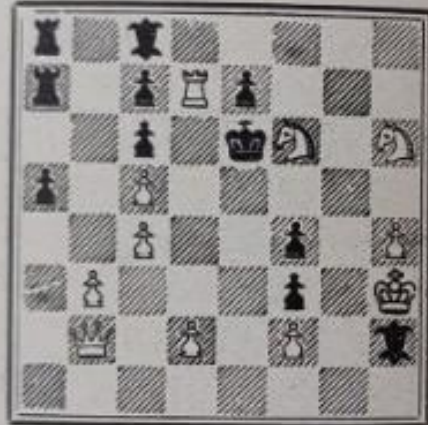
Mat en 3 coups 11+11