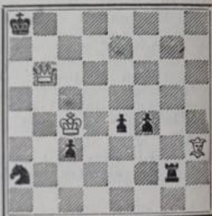
Mat en 4 coups 3+6