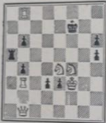
Mat en 3 coups 6+8