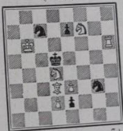
No 722. — E. Diard à Romainville (Inédit)