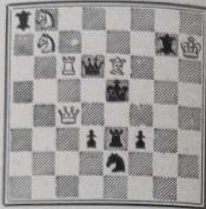
Mat en 3 coups 6+8