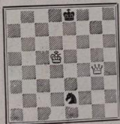
Mat en 3 coups 2+2