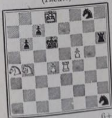
No 723. — G. Pinchon dédié à A. Marceil (Inédit)