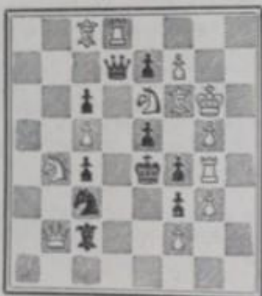
Mat en 2 coups 13+10