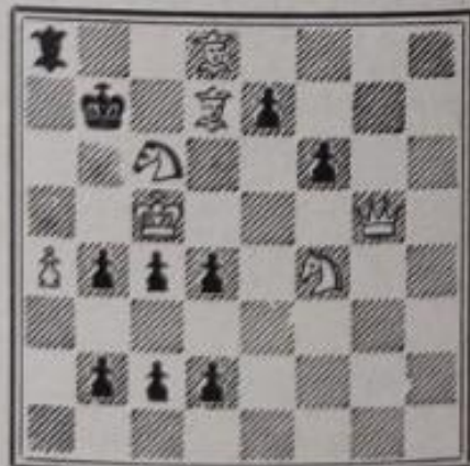
Mat en 3 coups 7+10