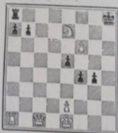
Mat en 3 coups 6+7