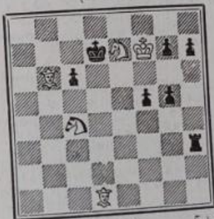
No 721. — E. Diard à Romainville (Inédit)