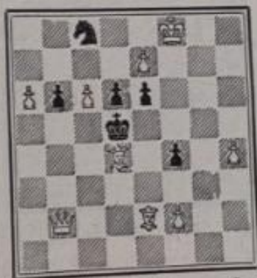
Mat en 3 coups 9+6

noir sur des cases différentes constitue un écho ; si les cases occupées par le Roi sont de couleurs opposées on dit qu'il y a écho caméléon .