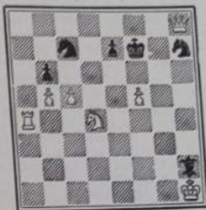
No 720. — R. Rouvinski à Paris (Inédit)