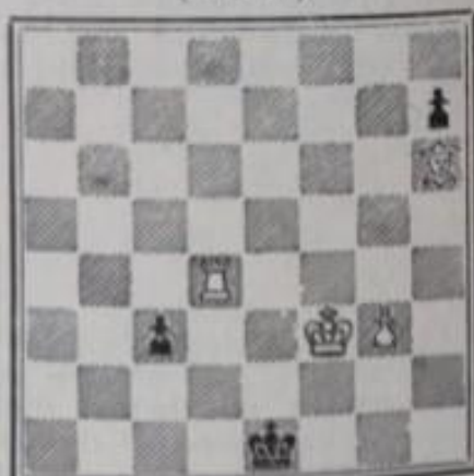
Mat en 3 coups 4+3