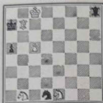
Mat en 4 coups 5+4