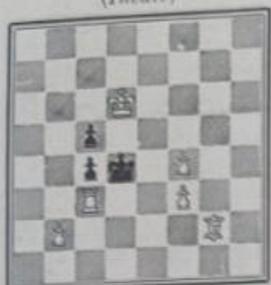
Mat en 6 coups 6+3