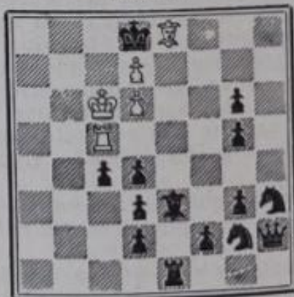
N o 699. — L. Lindner à Paris (Inédit)