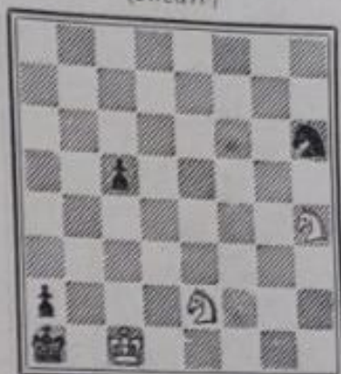
N o 636. — D. Decourdemanche à Reims (Inédit)