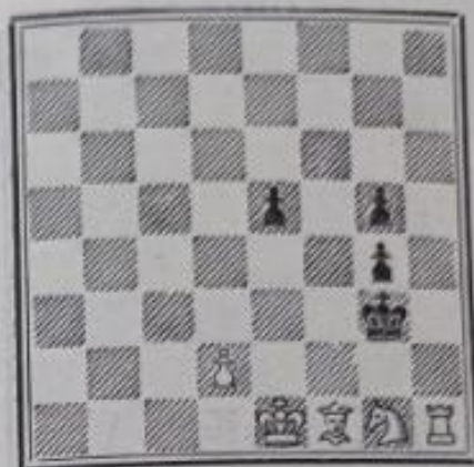
N o 635. — D. Andrieu Dédié à Fred. Lazard (Inédit)