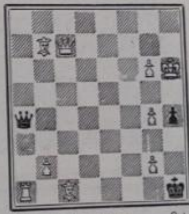
N o 638. — F. Paboucek à Paris (Inédit)