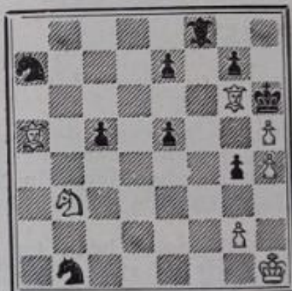
N o 637. — R. le Pontois à Beauvais (Inédit)