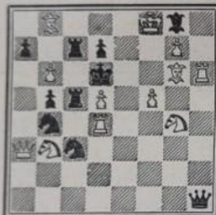
N° 613. — E. Salardini 1 er Prix. Western M. News (1933)