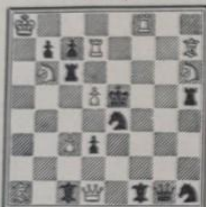
N° 612. — C. Schulz Die Schwalbe (avril 1933)

Les compositeurs actuels ne s'attardent plus guère sur les sentiers battus et cependant les tasks ou tours de force ne sont pas encore démodés; sachez qu'on désigne ainsi la répétition multiple d'un même élément stratégique. Dans le n° 612 la clé est 1. Da4 menaçant de DxO64 ; les défenses consistent à éviter la prise en jouant le cavalier noir sur les 8 cases possibles constituant la rosace complète