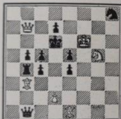
N° 632. — P. Chevalier à Provins (Inédit)