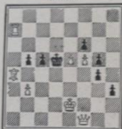
N° 631. — R. Rouvinski à Paris (Inédit)