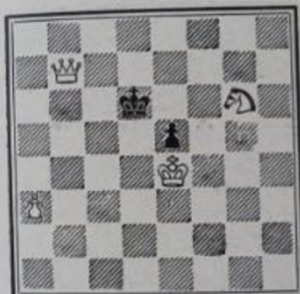
No 625. — Ch. Aubert à Pau (Inédit)