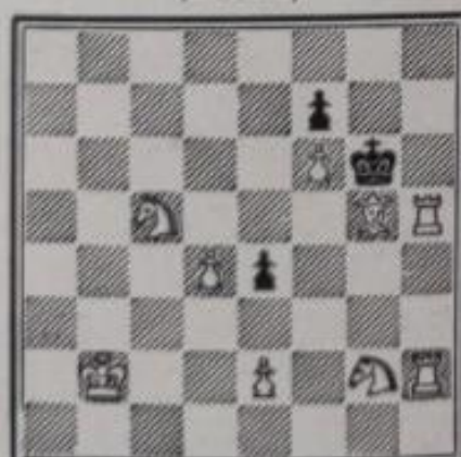
N° 634. — G. Schmitt à Algrange (Inédit)