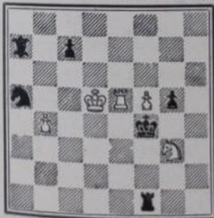
No 622. — J. van den Berg Prix. Die Schwalbe (1930)