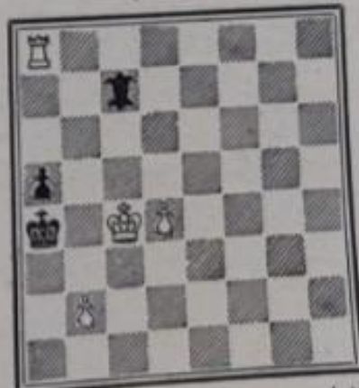
No 628. — Neddy Dédié à M.-A. Marceil (Inédit)