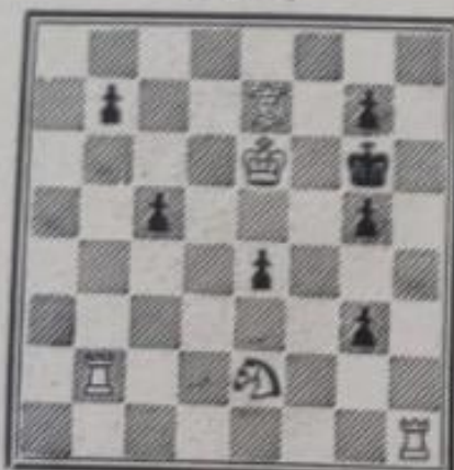
N° 633. — P. Chevalier à Provins (Inédit)