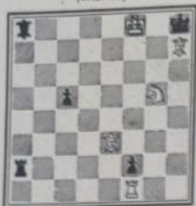
N° 629. — Neddy à Nantes (Inédit)