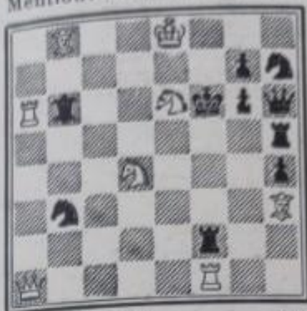
No 620. — G.-H. Goethart Mention. Handelsblat , 1917