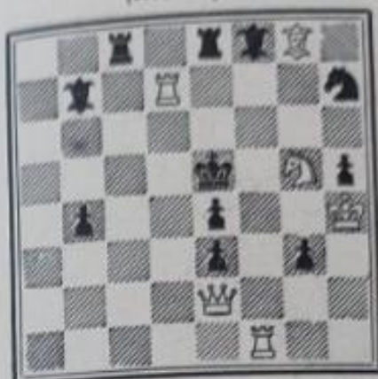
No 623. — F. Fraenkel à Strasbourg (Inédit)