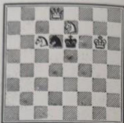
N° 630. — Fred. Lazard à Paris (Inédit)