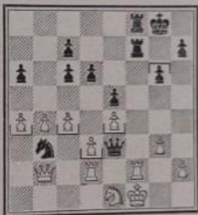
Position après le 29 e coup des noirs

Ce joli sacrifice donne le coup de grâce.