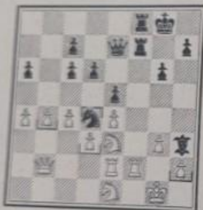
Position après le 25 e coup des noirs

Et voici le deuxième trou occupé. Le gain ne saurait maintenant demander longtemps.