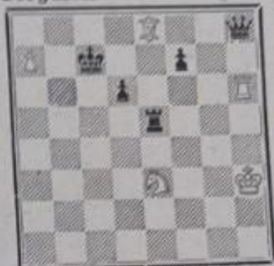
Les blancs jouent et gagnent

Trois thèmes sont réunis d'une façon très curieuse dans une seule variante : 1 er thème romain (1 er coup des blancs), 2 e promotion du pion blanc et 3 e domination de la Tour noire. 1 Cd5 +!-Td5 ; 2 a8c+1-Rb7 ; 3 Th8-Td3 ; 4 Rg2-Td2 +! ; 5 Rf3-Ra8 ; 6 Re3 (domination)-Tb2 ; 7 Fc6++-Ra7 ; 8 Ta8+ et 9 Tb8 et gagnent.