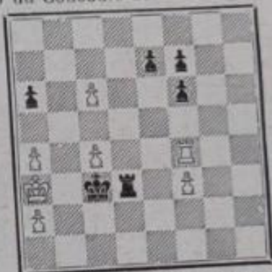
Les blancs jouent et gagnent

1 er prix ex-aequo du Concours des Zadatchi y Etudy , 1930