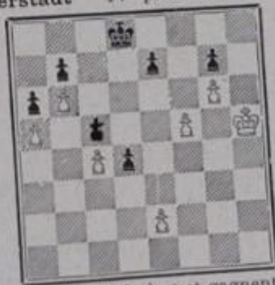
Les blancs jouent et gagnent

V. Halberstadt IV e prix du même concours