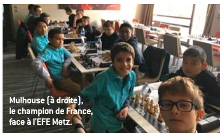
Mulhouse (à droite), le champion de France, face à l'EFE Metz.