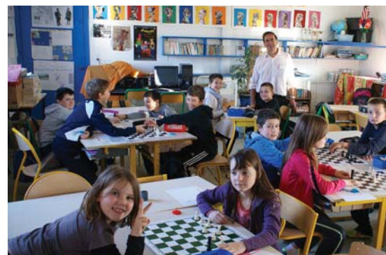
Le jeu d'échecs a fait son entrée dans les écoles d'Annonay