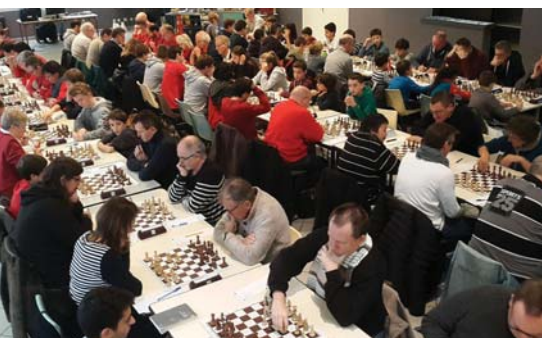
Près de 100 joueurs à Vandœuvre pour la phase départementale de la coupe Loubatière

22 équipes ont participé à la phase départementale de la Coupe Loubatière. Dont sept de Vandœuvre, le tenant du titre, et autant pour Nancy-Stanislas, le détenteur de la coupe 2000.