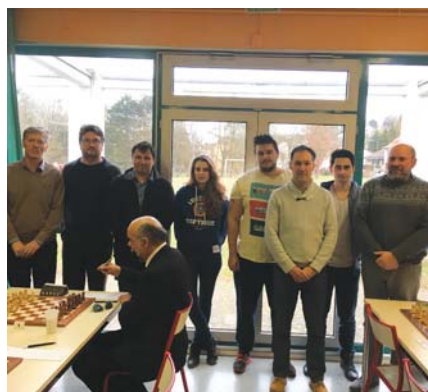
Les joueurs de Metz bientôt de retour en Top 12.

6-0 ; 6-0 ; 6-1. Un score de tennis. Et pourtant, nous ne sommes pas en Coupe Davis. Ce sont en fait les résultats de trois matchs de Metz-Fischer dans le groupe B de Nationale 1. Ajoutez à cela un 7-0 et surtout un 8-0 face à Drancy. Aux deux tiers du championnat, les Lorrains comptent sept victoires en autant de rondes, avec seulement trois points d'échiquier concédés sur 56 parties individuelles. Ils ont surtout écrasé toute concurrence en