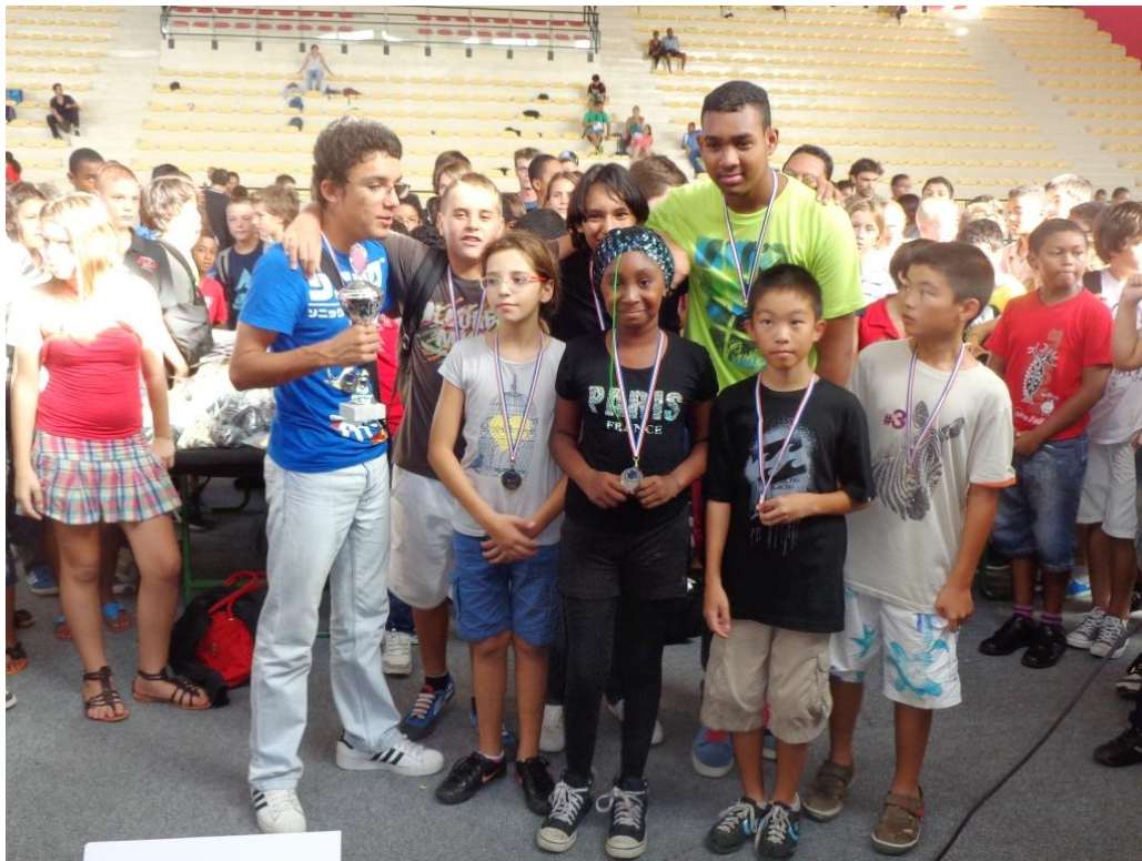
L'équipe de Saint-Charles garde le sourire et son fier de sa deuxième place !