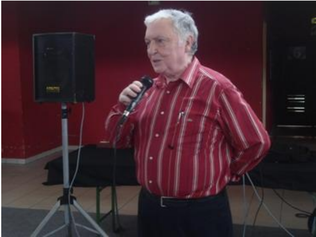
« les noirs appuient et les blancs jouent », Monsieur le Maire lance la ronde.