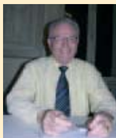
Christian Bernard Formation des Arbitres