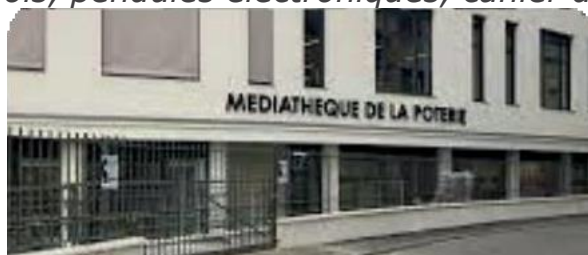
Le stage a lieu la Médiathèque de la Poterie 10 allée Jean-Baptiste Lully 92150 SURESNES

Supports pédagogiques : cours en vidéoprojecteur, exercices sur papier, échiquiers en bois, pendules électroniques, cahier du stagiaire.