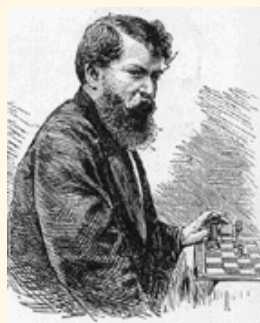
Wilhelm STEINITZ au début du XIX e siècle