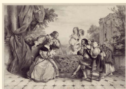
Scène galante d'échecs (1840)

Vers 1740, le Café de la Régence à Paris est le théâtre des plus belles parties d'Échecs, PHILIDOR y croise DIDEROT. Pendant la révolution, ROBESPIERRE ou Camille DESMOULINS viennent y jouer. L'activité échiquéenne du Café de la Régence ne s'arrêtera que vers 1920. Au milieu du XIX e siècle, l'univers des Échecs devient plus structuré, doté de ses écoles et de ses champions auxquels sont dédiés traités, chroniques et revues. L'ère de la compétition s'ouvre en 1851 avec un premier tournoi international organisé à Londres. Souvent bien dotés, tournois ou matchs confrontent les champions Européens, mais aussi l'Américain Paul MORPHY (1837-1884). Les maîtres gagnent encore en prestige et font la une des quotidiens.