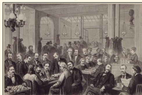
Café de la Régence vers 1870